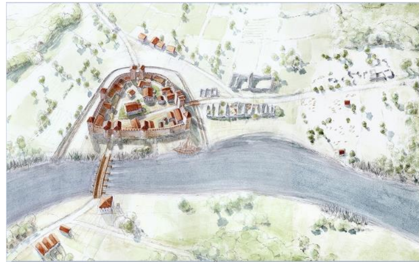
Abb. 2. Solothurn um 400 n.Chr. – ein spätantikes Castrum.

Als Etappenort und Brückenkopf an der Strasse durchs Schweizer Mittelland angelegt, entwickelte sich der vicus Salodurum rasch zu einem kleinstädtischen Zentrum. In der ersten Hälfte des 4. Jahrhunderts n.Chr. wurde die offene Strassensiedlung dann in eine befestigte Siedlung, in ein castrum , umgewandelt. Das spätantike castrum war von einer hohen Mauer umgeben und nur noch etwa halb so gross wie der frühere römische vicus . Ausserhalb der Mauern lag die spätantike Nekropole, aus der sich im Laufe des Frühmittelalters ein zweiter, kirchlich-sakraler Siedlungsschwerpunkt rund um die Grabstätte des St. Urs entwickelte.