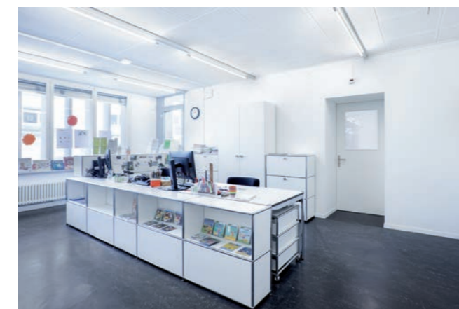
Kinder- & Jugendbibliothek UG