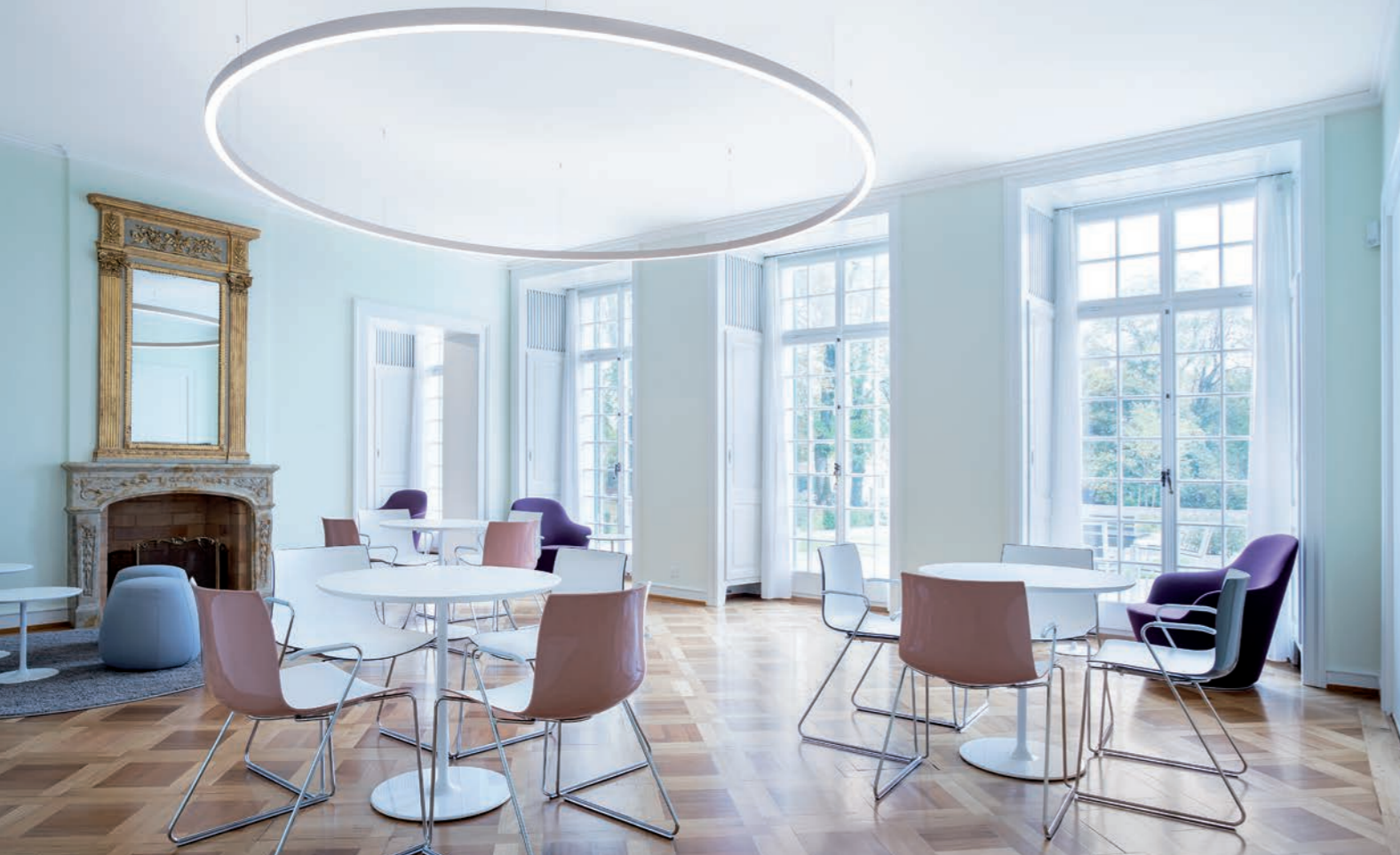
«Zettercafé» im Zetterhaus EG