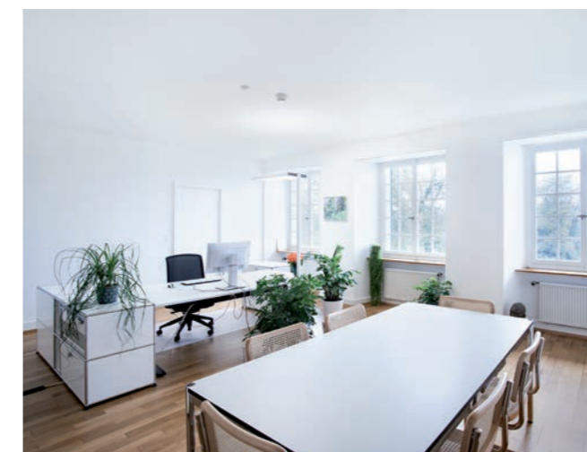
Direktion 2. OG