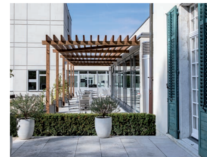
Aussenpergola zum Barockgarten